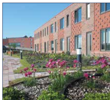
HANZEWIJK - KAMPEN