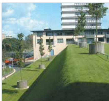
WINKELCENTRUM EN PARKEERDAK - RIJSWIJK