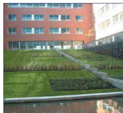
KANTOORCOMPLEX - AMSTERDAM