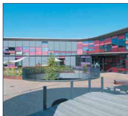
BREDE SCHOOL / WIJKHUIS WESTWIJZER - HELMOND