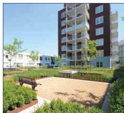
WOONCOMPLEX STATIONSKWARTIER - WEERT