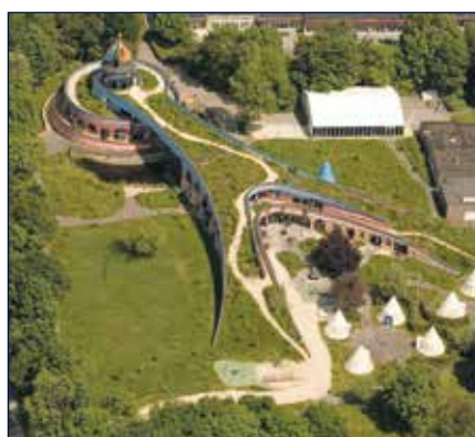
RONALD MCDONALD KINDERVALLEI - VALKENBURG