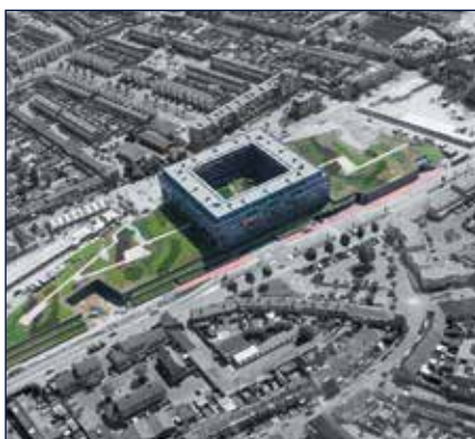
PARKEERGARAGE EN SUPERMARKT - TIEL