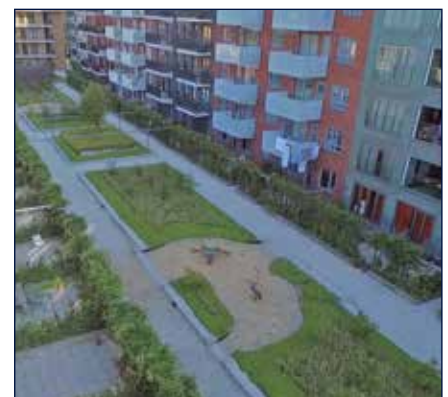
NIUW-CROOSWIJK - ROTTERDAM