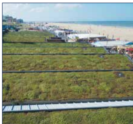
SEA LIFE CENTER - DEN HAAG