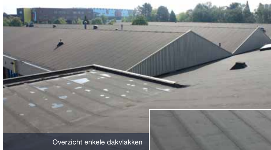
Overzicht enkele dakvlakken