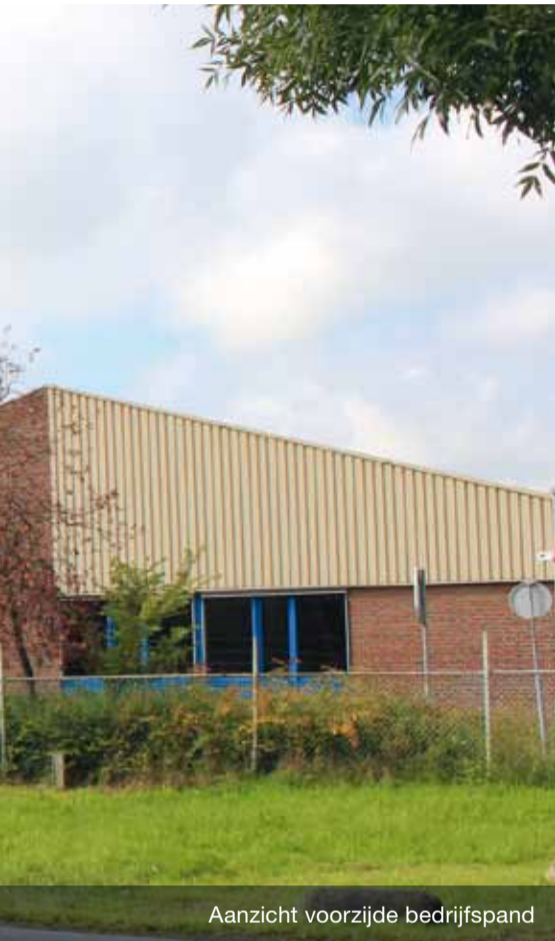
Aanzicht voorzijde bedrijfspand

Het gehele complex heeft altijd deel uitgemaakt van de onderzoeken ten behoeve van lange duur gedrag van Wédéflex producten en wordt zodoende ook vermeld in ons Komo-attest-met-productcertificaat. Zo wordt in zowel het BDA Duurzaamheidsrapport uit 1997 als in het BDA Rapport 'lange duur gedrag en ervaringen met Wédéflex Established products' uit 2004 geconcludeerd dat de conditie van de deklaag van de toplaag overwegend goed is en dat er op diverse daken sprake is van lichte craquelé in het oppervlak.